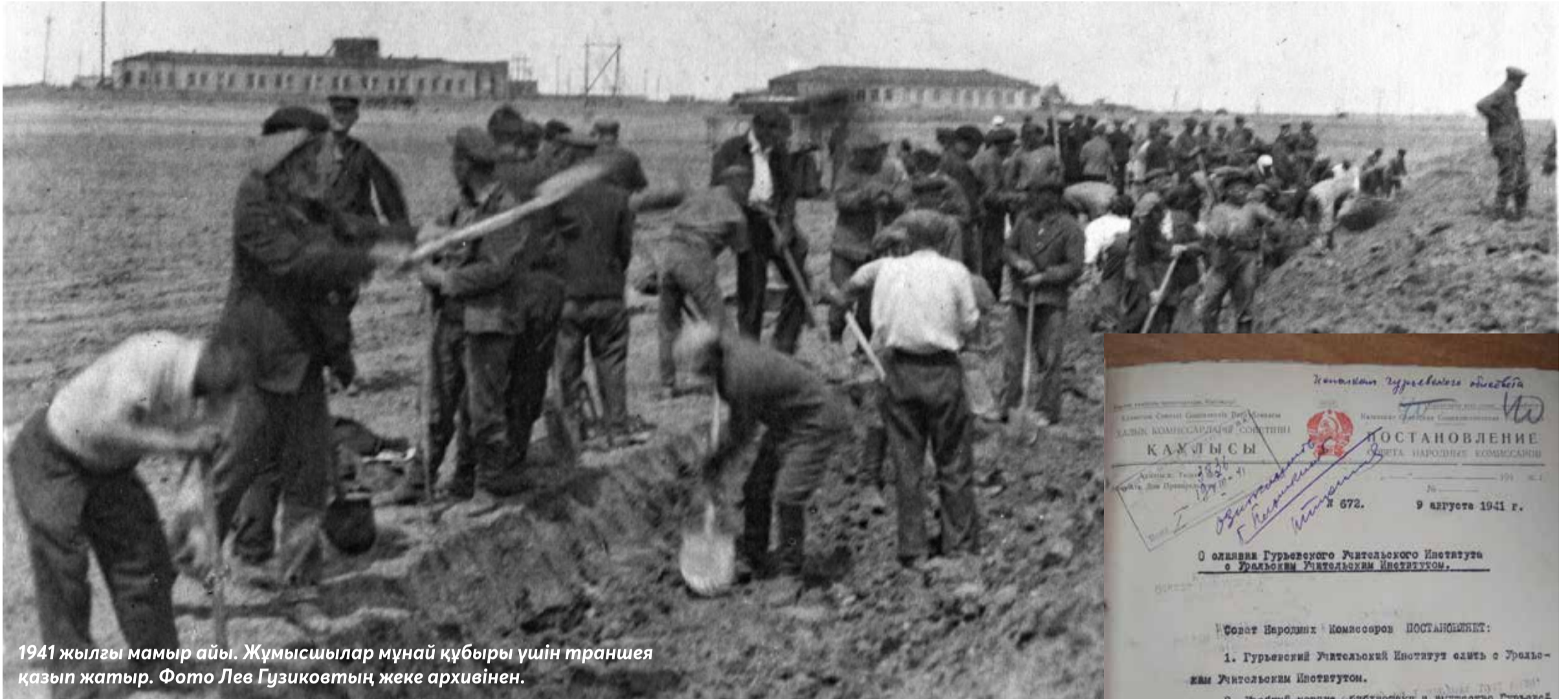
1941 жылғы мамыр айы. Жұмысшылар мұнай құбыры үшін траншея қазып жатыр.

Соғыс басталған алғашқы айларда 1941 жылдың 12 шілде күнгі «Социалистік құрылыс» газетінің бетінде «Гурьев мемлекеттік оқытушылар институты 1941–42 оқу жылына қарай тарих, тіл және әдебиет (орыс, қазақ бөлімдерінің) факультеттерінің бірінші курсына оқушылар қабылдайды», «Гурьевтегі мемлекеттік оқытушылар институты 1941–1942 оқу жылына студенттер қабылдауды жариялайды» тақырыбында жарнамалар берген.